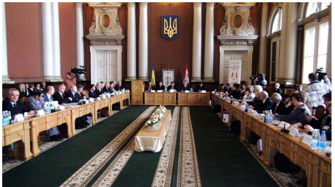
Февраль 2013. Семинар «Укрепление украинско-канадского партнерства в сфере высшего образования» (Львовский политехнический национальный университет).

В современной России реформы последних двух десятилетий внедрили множество элементов западной культуры и образования (ЕГЭ, Болонский процесс, ювенальная юстиция, половое воспитание и образование в контексте современных западных ценностей и прочие). Эти элементы в ряде случаев кардинально вытеснили традиционно отечественные формы и элементы образования. Современные инициативы по поводу единого учебника истории, изменения распределения часов на изучения русского и иностранного языка и другие изменения, направленные на учет национальных интересов в системе образования, конечно, требуют профессиональной экспертизы и оценки, и очевидно, что такие оценки будут неоднозначны. Но, безусловно, современное образование — это сфера национальной безопасности, и любые принимаемые в образовании содержательные и организационные решения должны быть оценены на последствия в плане национальной безопасности.