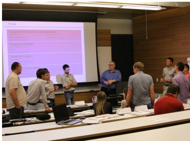
Командный проект в рамках курса «Системный инжиниринг» (МФТИ).

Для системы образования важно, что фиксация достижений и поощрение побед — то есть «логика игровых достижений» — в жизни потребует реализации моделей оценки репутации и опыта, принятых в играх. Игра как стандарт деятельности повысит спрос на навыки командной работы. Здесь прослеживается тенденция: возрастает роль исследовательских коллективов в науке, роль политических команд, роль экономических групповых организации, значение взаимодействий. Умение работать в команде, установка на такое взаимодействие потребует признания этих качеств основной мета-компетенцией обученного лица. Командная игра и командная работа как доминирующие формы образования и социальной жизни изменят процедуры образовательных аттестаций. Уже сегодня фиксируется тенденция перехода от экзаменов к практическим командным проектам как формам итоговых аттестаций, происходит массовое включение игр и симуляторов в итоговые аттестации в статусе проектов.