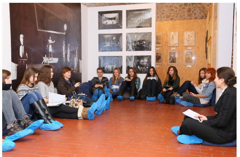
Занятия студентов Ягеллонского университета в Краковском историческом музее.

Игровое обучение имеет тенденцию распространять свой статус от «украшения» серьезного образования до замены собой собственно образования. Такое образование может длиться в течение длинного цикла, осуществляя подстройку под уровень развития играющего (то есть обучающегося). Целью такой игровой подстройки станут не только знания и навыки, но и определенные физиологические состояния. Формирование и научение формированию «ресурсных состояний», в которых любая деятельность осуществляется быстро, без стресса, с эффективным достижением результата (например, школы управления вниманием», школы здорового образа жизни), будет способствовать стиранию грани не только между игрой и образованием, но и между игрой и трудовой деятельностью. Жизнь и работа в виртуально-реальных мирах будет восприниматься как норма. От системы образования потребуется достаточно быстрый переход от управления передачей знаний — от формирования картины мира, языковой компетентности, интеллектуального развития — к формированию социальных и управленческих навыков, а далее к управлению ресурсными психофизическими состояниями.