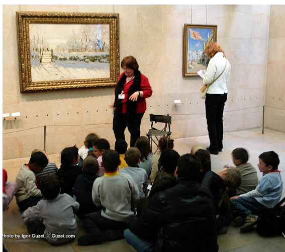
Школьный урок в музее Д'Орсэ, Париж.

Нынешнюю картину образовательного пространства в будущем будет менять не только техническая среда, но и доминирование игровых сред как формата взаимодействия между людьми. Независимо от возраста и достигнутого ранее уровня образования, обучающиеся в игровых форматах во «внеаудиторной обстановке» (в кафе, клубе, парке, галереи) в развлекательной и наглядной форме образуются. Повсеместное проникновение дополненной реальности, по крайней мере, в мегаполисах, придаст пространству города статус пространства игры и познания, точнее, игрового образования.