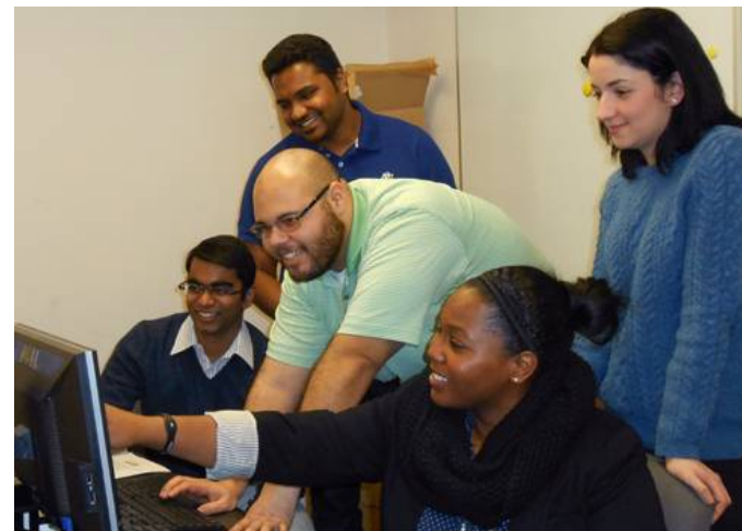
Студенческая команда тестирует безопасность интеллектуальной сети (Сиракузский университет, США).

Сопровождающий описанные тенденции рост роли сообществ практик (реальных и виртуальных) потребует изменения формы и статуса документов об образовании. При появлении все большего количества внесистемных провайдеров образования, возникнет ситуация, когда появится возможность отдельному индивиду не быть задействованным в институтах формального образования даже на протяжении всей жизни.