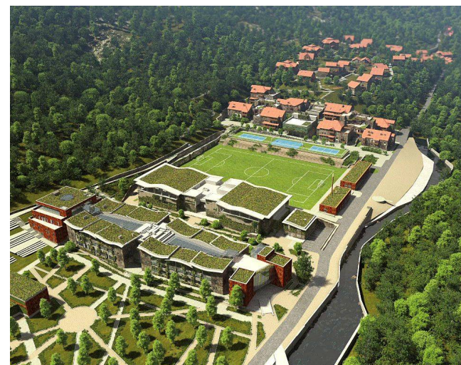
Проект международной школы UWC Dilijan College.