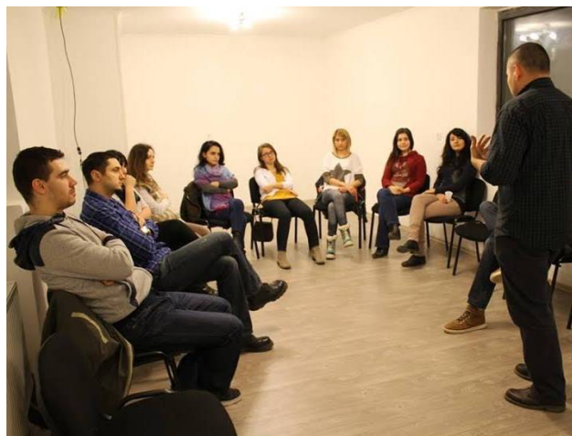
Программа «Философия для детей» (Philosophy for Children, P4C) в Хорватии (слева) и России (справа).