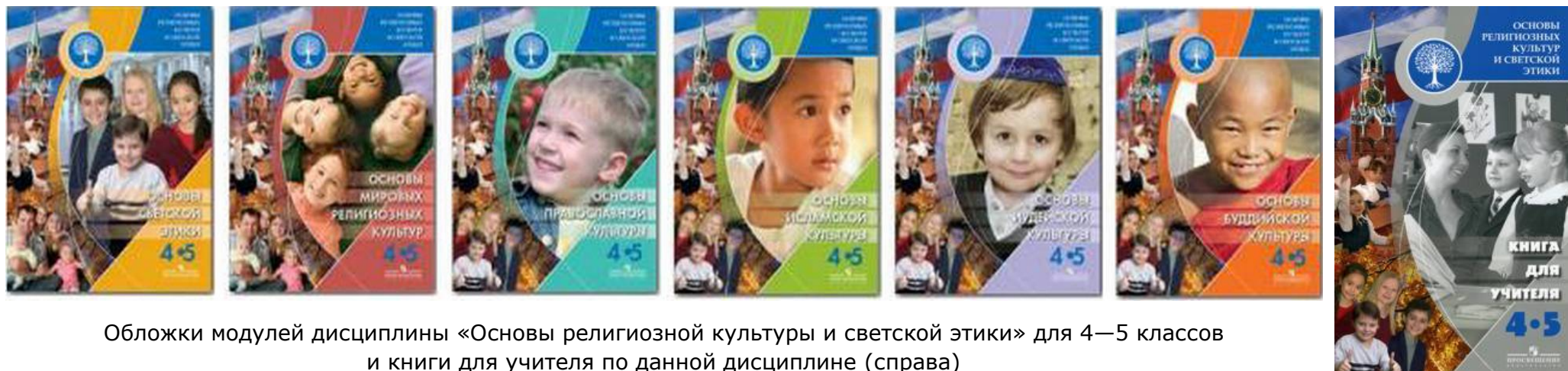
Обложки модулей дисциплины «Основы религиозной культуры и светской этики» для 4—5 классов и книги для учителя по данной дисциплине (справа)

Приведем пример. В условиях конституционного отделения государства от церкви государство в содержании и организации образования стремится соблюдать его светский характер. Религиозные же организации заинтересованы в расширении конфессиональной ориентации образования (ценностный аспект), в создании в системе образования отдельного элемента — конфессиональных образовательных учреждений (системный аспект), в соблюдении религиозных культовых практик в процессе образования (процессуальный аспект), в признании государственными органами дипломов, выданных конфессиональными образовательными структурами (результативный аспект). Так, в современном российском образовании при выборе одного из модулей дисциплины «Основы религиозной культуры и светской этики» фиксируются реальные противоречия между позициями родителей внутри одного класса, позицией родительского сообщества в целом и администрации школ. Крайне неоднозначны оценки практики преподавания данного курса в российских школах.