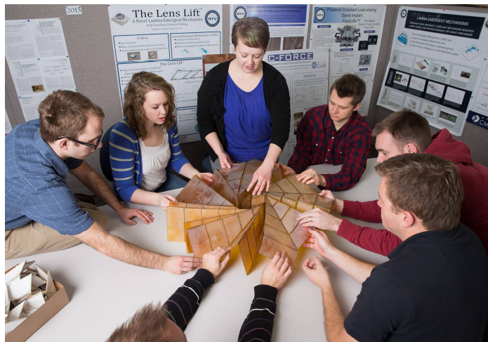
Командный проект по созданию прототипа солнечного элемента для космического модуля «Оригами» (Университет Бригама Янга, США).