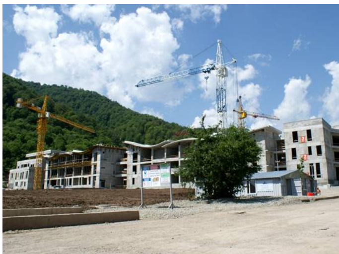
На строительстве международной школы «Дилижан».

Например, Армения недавно объявила о строительстве элитной школы нового типа. Огромный учебный комплекс площадью 35 тыс. кв. м (первая очередь проекта) начнет свою работу в 2015/16 учебном году. Общая площадь комплекса после завершения строительства второй очереди в 2016 г. составит 60 тыс. кв. м. За парты учебного заведения сядут студенты в возрасте от 16 до 19 лет, а с 2017 г. откроется учеба для учеников 13—16 лет. Все преподавание будет вестись на английском языке, поскольку ожидается, что учиться приедут дети более чем из 100 стран мира. К 2023 г. рост