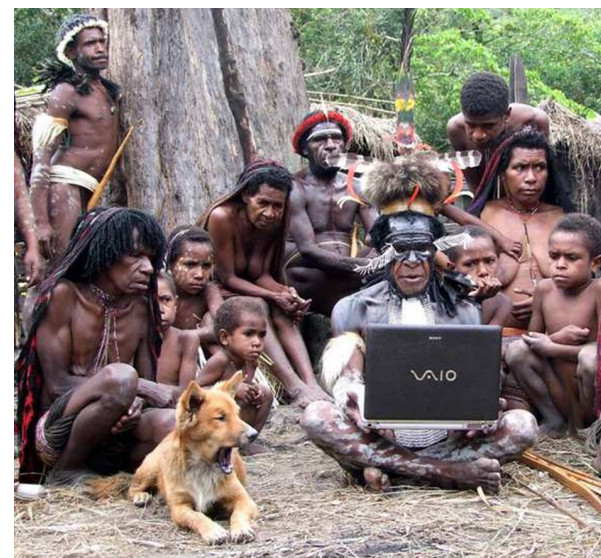
Распространение мобильных технологий.