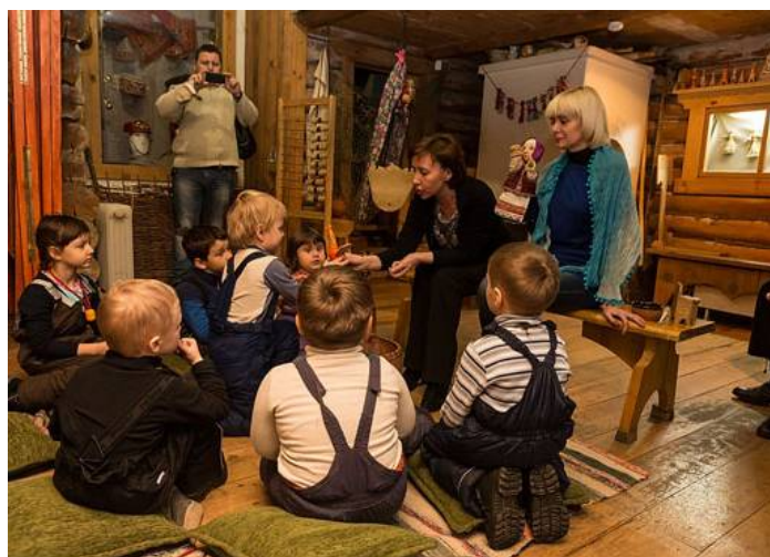
Урок в музее «Тульские древности», музей-заповедник «Куликово Поле».